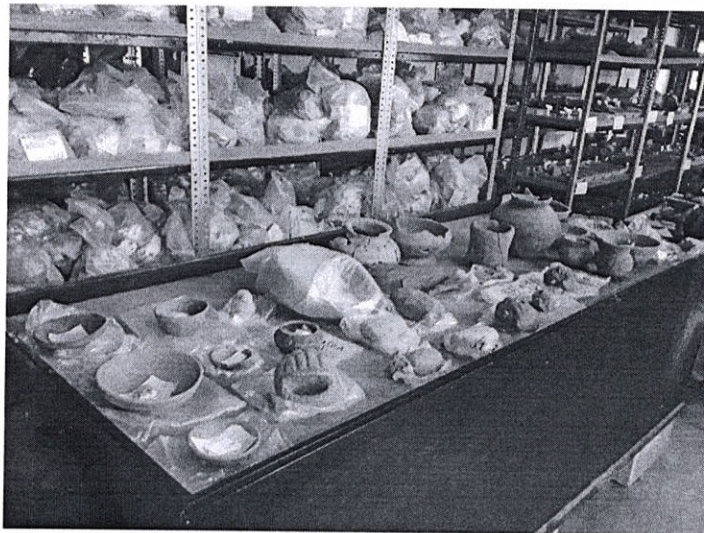
Foto 2: Parte de los artefactos arqueológicos buscados, procedentes de Finca Santa Margarita (Flores 2019).